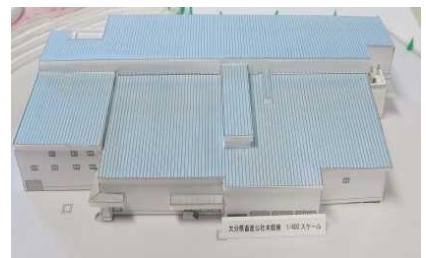
食肉処理施設の完成予想模型

施設完成後、それぞれの国の輸出認定を取得する必要があるため、県内からの輸出は数年後になりますが、市場調査等のため、フェア等に積極的に参加しておりますので、皆様の国で行われる際には是非お立ち寄り下さい。