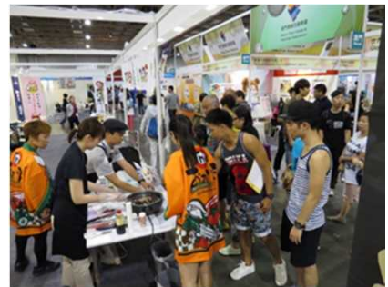
マカオでのプロモーションの様子