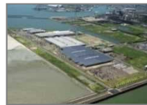
2. トヨタ自動車九州（株） 小倉工場・苅田工場