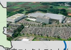
8. 東京エレクトロン九州（株）