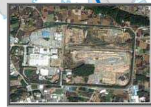
6. 本田技研工業（株） 熊本製作所