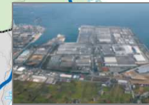
4. ダイハツ九州（株） 大分工場