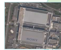
7. ソニーセミコンダクタ（株） 熊本テクノロジーセンター