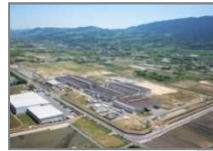
5. ダイハツ九州（株） 久留米工場