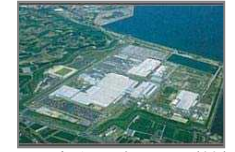
3. 日産自動車九州（株） 日産車体九州（株）