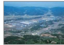
1. トヨタ自動車九州（株） 宮田工場