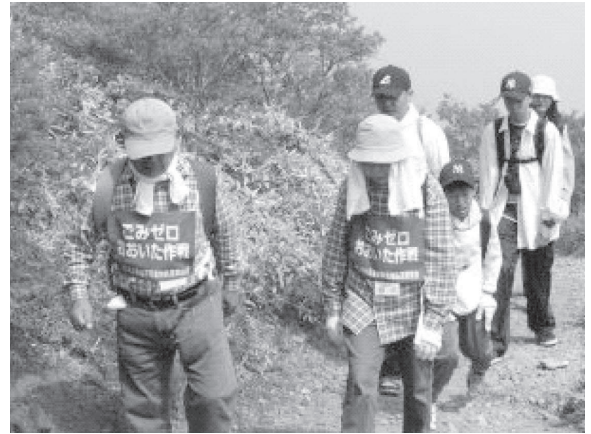
エコ・コミュニケーション（九重町）

エコ・ボランティアとして登録したメンバーが、「楽しみながら環境活動を。」をキーワードに県内で行われる環境学習の催しや清掃活動、歴史風土にまつわる伝統行事などの様々なイベントに参加し、地元の方々との交流を図りながら実践活動に取り組む「エコ・コミ