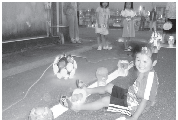
「蒲江版キャンドルナイト」(佐伯市蒲江)

「昭和の町」で有名な豊後高田市では昭和ロマン蔵でキャンドルの灯りの下で少年少女合唱団やフルートアンサンブルの演奏を楽しむ「音楽の夕べ in 昭和ロマン蔵キャンドルナイト」が、佐伯市蒲江ではカンテラや特産の緋扇貝を使ったトーチで蒲江浦湾岸散策路を彩る「蒲江版キャンドルナイト」が実施されるなど、県下各地で特色ある取組が展開された。