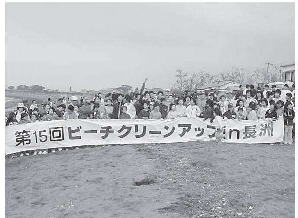
エコ・コミュニケーション（宇佐市）

ュニケーション実践事業」を平成16・17年度にかけて延べ20回実施した。（平成17年度エコ・コミュニケーション実践事業開催行事は表1-1a.）