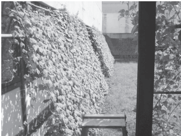
緑のカーテン（豊後大野市）

この取組の一環として、秋には食材の使い切りや省エネ調理法に取り組む「エコ・クッキング」を普及させる『エコ「食」ライフ』、冬には重ね着等に取り組む暖房の設定温度を抑制する『エコ「暖」ライフ』の実践を呼びかける予定である。