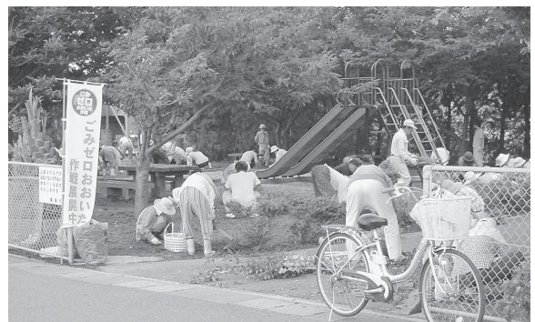
121万人県民一斉ごみゼロ大行動(姫島村)

美しく快適な大分県づくり条例に基づく「環境美化の日」の取組として8月に県下全域を対象に美化活動の実施を呼びかけるとともに、美しい観光地づくりを目指して秋の行楽シーズンに合わせて10月に観光地やイベント会