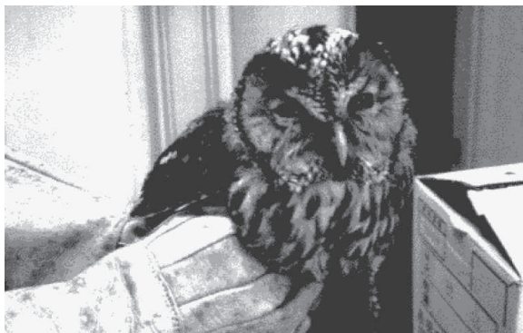
保護されたフクロウ（傷病鳥獣）