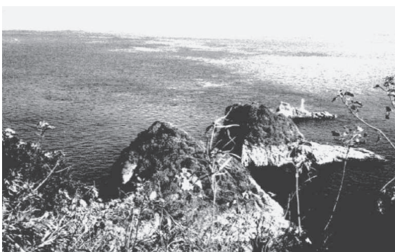
高島のウミネコ生息地

鳥獣の保護を図るため、 鳥獣保護区 及び特別保護地区を指定するとともに、狩猟鳥獣の増加を図るため、 休猟区 を指定している。鳥獣保護区は、平成18年11月1日現在で、県下で69か所、県土面積の約7.2%にあたる45,934haを指定している。また、鳥獣保護区内で特に重要な鳥獣生息地10か所については特別保護地区に指定し、この中には天然記念物カラスバトの生息地として知られる佐伯市（旧蒲江町）の沖黒島や、ウミネコが営巣する大分市（旧佐賀関町）の高島などが含まれている。