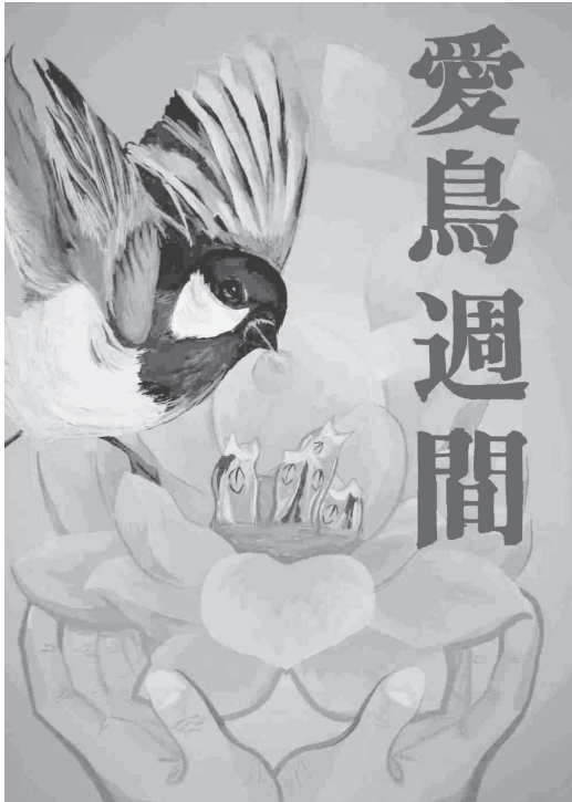
平成19年度愛鳥週間用ポスター原画応募作品